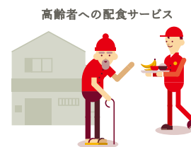
高齢者への配食サービス

今日までの皆さまのご協力に感謝しますとともに、本年度も一層のご理解、ご協力をよろしくお願いいたします。