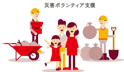
災害ボランティア支援

今年も、10月1日から12月31日の3か月間、全国一斉に赤い羽根をシンボルとした「共同募金運動」が始まります。