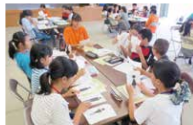
体験学習のようす