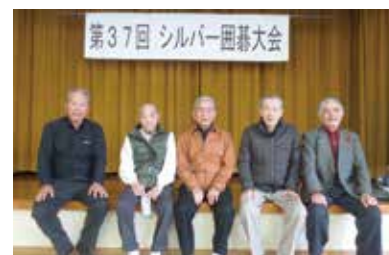
優勝者の皆さんです(右社協会長)