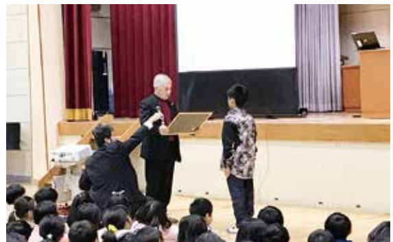
大川小学校での授与式のようす

平成30年10月22日(月)に福岡国際会議場で福岡県社会福祉大会が開催され、その中で大川小学校が、赤い羽根キャッチフレーズで特別賞を授与されました。また、粕屋町支会が優秀地区として、福岡県共同募金会会長表彰を受けました。この受賞は、共同募金運動に対する、地域の皆さまの深いご理解、ご協力のお蔭です。改めて厚くお礼申し上げます。