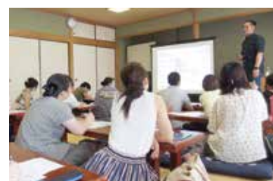
勉強会のような様子