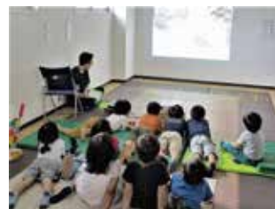
さんさんが映画館に变身! さんさんシアターを開催しています