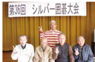
優勝者のみなさま

生き甲斐づくりやお互いの交流を深める事を目的に町内の60歳以上の囲碁愛好家を集い、囲碁大会を年に1回開催しています。