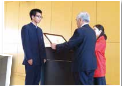
今年度、赤い羽根キャッチフレーズで大川小学校・福岡魁誠高等学校が特別賞を受賞され、授与式が学校で執り行われました。