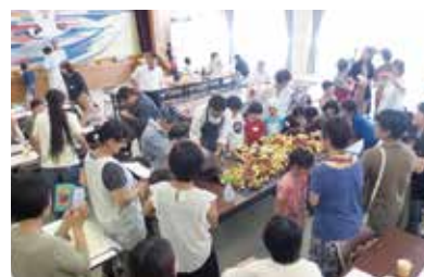
親子交流会のようす

知的障がいや発達障がいのある人や子どもと暮らす家族を対象に、同じ悩みをもつ家族同士が交流したり、親子の関わりを深めたりすることができるような場や機会の提供を目的に開催しています。