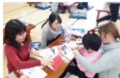
子育て応援サロンのようす

発達障がい児(年中~小学1年生)の療育(作業療法士と臨床心理士が毎月交代)と親同士の交流を目的に大学生ボランティアの協力を得て子育て応援サロン(療育児・親子サロン)を開催しています。(月1回)