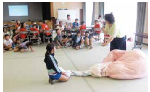
産まれる体験のようす