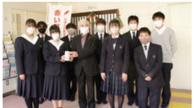
▲福岡県立福岡魁誠高等学校 ボランティア研究会