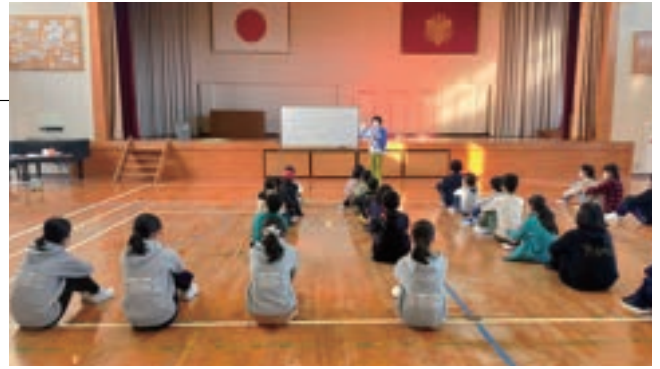
▲児童・生徒対象福祉体験学習の推進事業