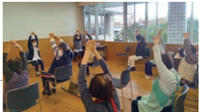
▲身体障がい者生きがい対策支援事業